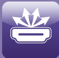
Quad HDMI Output